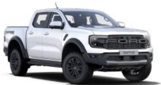
ARCTIC WHITE - LAKIER ZWYKŁY bez dopłaty