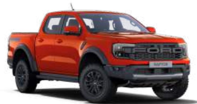
CODE ORANGE - LAKIER PERFORMANCE 3 200 zł