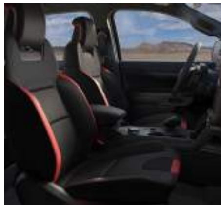
Ford Ranger Raptor ze skrzynią automatyczną i sportowymi fotelami (standard)