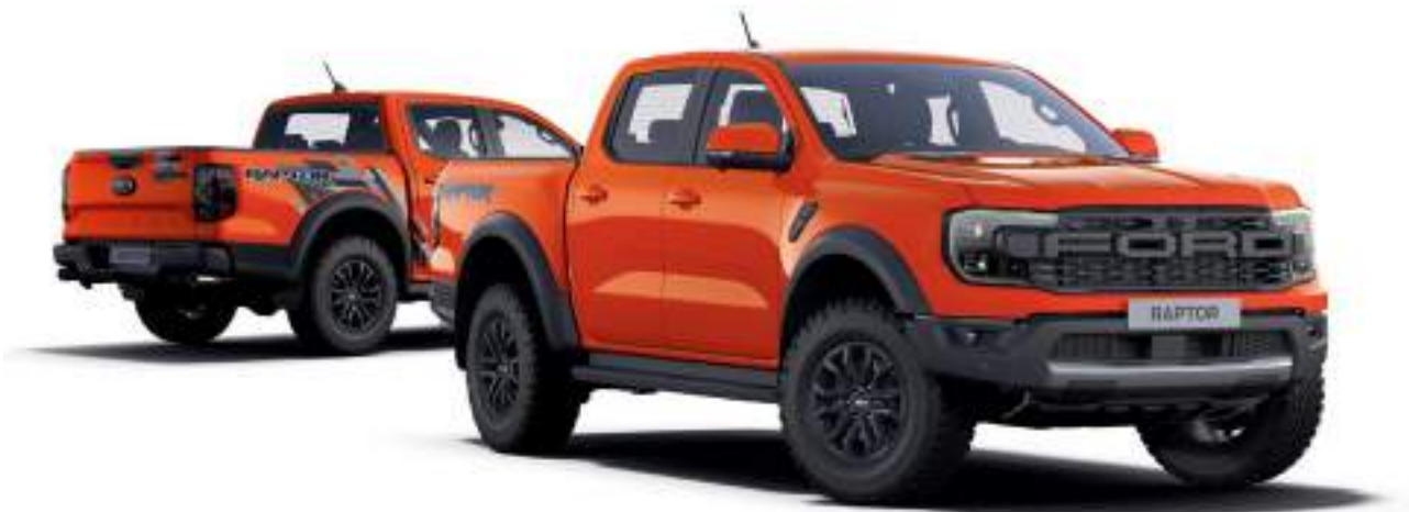
Ford Ranger Raptor Kolor nadwozia Code Orange (opcja)