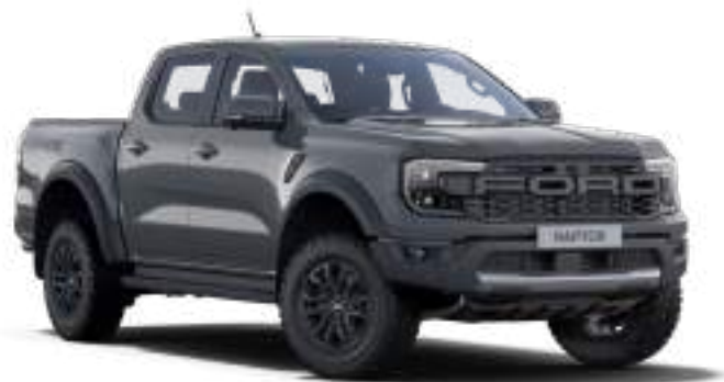
COMMAND GREY - LAKIER PERFORMANCE 3 200 zł