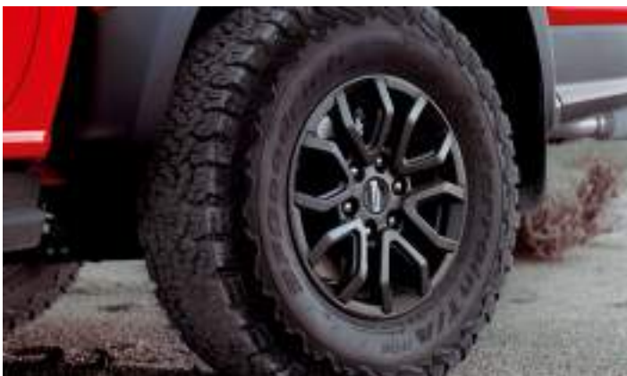
17" OBRĘCZE KÓŁ ZE STOPÓW LEKKICH Wyposażenie standardowe