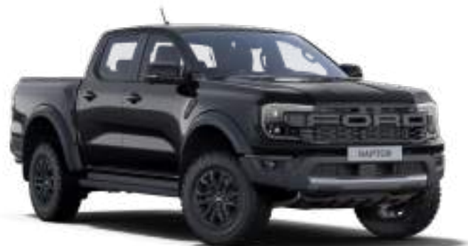
ABSOLUTE BLACK - LAKIER METALIZOWANY 3 200 zł