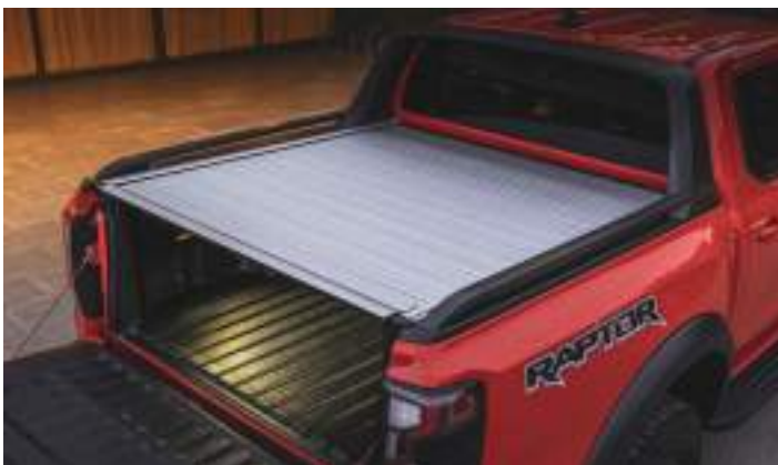
ELEKTRYCZNA ROLETA SKRZYNI ŁADUNKOWEJ ORAZ SPORTOWA CZARNA NAKŁADKA SKRZYNI ŁADUNKOWEJ 9 000 zł