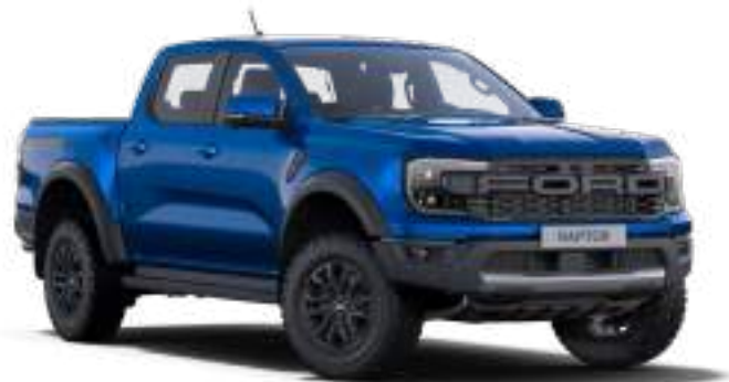
BLUE LIGHTNING - LAKIER METALIZOWANY 3 200 zł