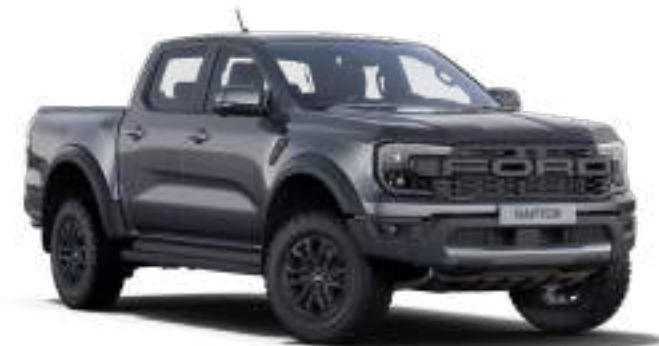
METEOR GREY - LAKIER METALIZOWANY 3 200 zł